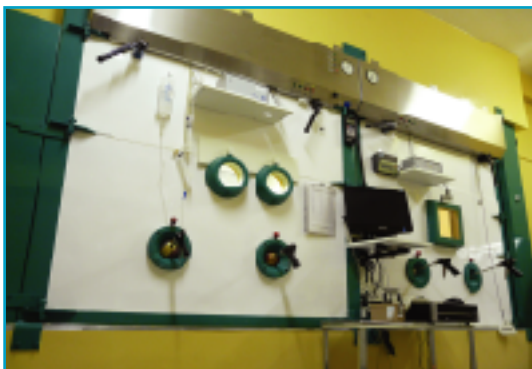
Producción automatizada de generadores